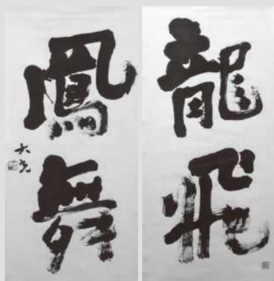
《龍飛鳳舞》 1993年 各 137.0×67.9cm 墨・紙、軸装