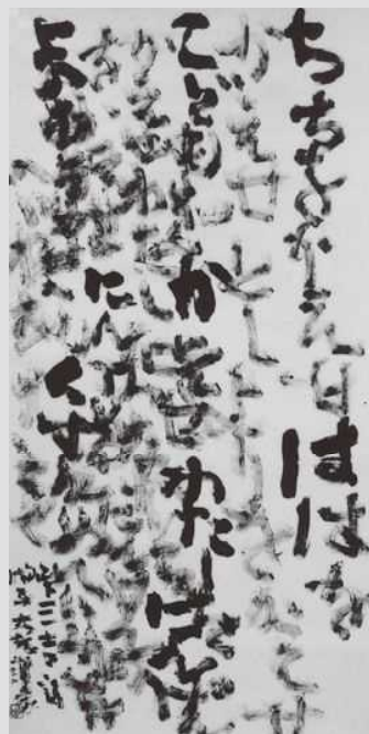
《峠三古詩》 2008年 134.8×68.3cm 墨・紙、軸装