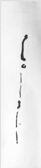
《FUKUSHIMA》 2012年 137.7×34.1cm 墨・紙、軸装