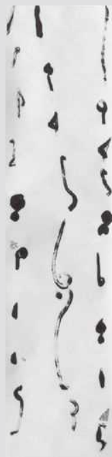
《広島・長崎・沖縄》 2010年 137.0×33.5cm 墨・紙、軸装