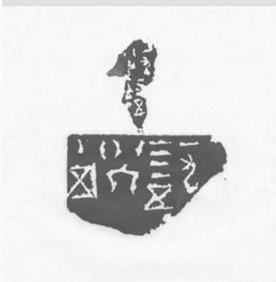
《HIROSHIMA・NAGASAKI》 2006年 31.2×21.8cm 印泥・紙、額装