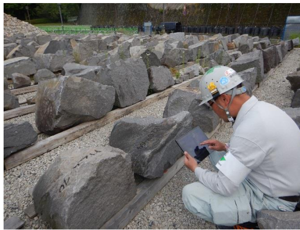
石材置き場で結果を確認する様子