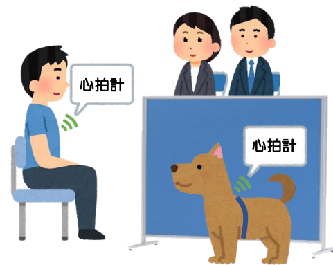
図1 実験の様子。飼い主は見学者の前で、暗算や文章の説明課題を実施しました。この間、イヌは飼い主のみ見ることができ、見学者とは交流できません。飼い主とイヌには心拍計を装着し、実験後に心拍変動解析を実施しました。

実験では13組の飼い主とイヌのペアを解析しました。飼い主には、イヌから見える位置に座ってもらい、見学者の前で安静にする、あるいは暗算や文章の説明のような心的なストレスを経験してもらいました（図1）。その最中、イヌと飼い主の心拍をモニタし、また行動をビデオで解析しました。その結果、いくつかの飼い主とイヌのペアでは心拍変動解析の数値が同期化しました（図2左）。しかし、すべての飼い主とイヌのペアで心拍変動解析の数値が同期化するわけではありませんでした。そこで、その違いを調べると、飼育期間が長い飼い主では同期しやすいことがわかりました（図2右）。今回の研究から、ヒトの情動変化がイヌの情動変化へと伝染することがわかりました。その伝染は秒単位での変化として検出されました。また、飼い主との生活が長くなることで、伝染しやすくなることも示されました。これまで、この「情動伝染」の進化理論として、遺伝的關係性よりも生活環境の共有がその進化要因であることが示されてきました。今回、ヒトとイヌという異種間（遺伝的には関係のない個体間）において、飼育期間が長いことつまり生活環境の共有が長いことによって情動伝染が起こりやすくなること示され、進化理論に合致した結果となりました。